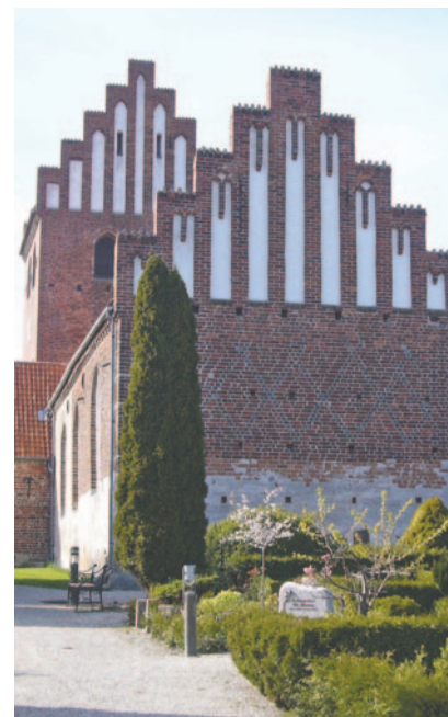
BUSK gudstjenesten afholdes i år i Høje Taastrup Kirke.

Det er et samarbejde på tværs af sognene mellem Taastrup Nykirke, Rønnevang Kirke og Høje Taastrup Kirke. Det plejer at gå på tur i de tre forskellige sogne, og i år er BUSK kommet til Høje Taastrups Kirke. (BUSK står for børn, unge, sogn, kirke)