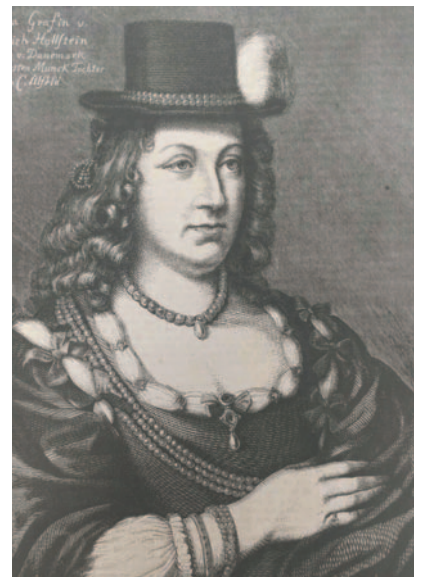
Leonora Christina Ulfeldt har ligget begravet i Maribo Domkirkes krypt.

Sidste frist for tilmelding er fredag den 15. oktober.